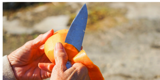
食品や植物の使わない部分"のこり"で染色する「のこり染」を用いたつまみ細工作品

なお、堂上蜂屋柿の名称使用をご快諾いただいた「JAめぐみの」に心より感謝申し上げます。今後も地域と連携しながら、ぎふSDGs推進パートナーとして、食と農の背景を伝える「小さな食育工芸」の取り組みを広げてまいります。